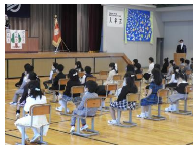
椅子の間隔を広くとった入学式