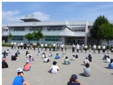
校庭で行った新任式・始業式

とし、さらに、「やる気 げん気 ほん気 あいさつ せいりせいとん」をスローガンに掲げ、知・徳・体のバランスの取れた子どもの育成を目指します。